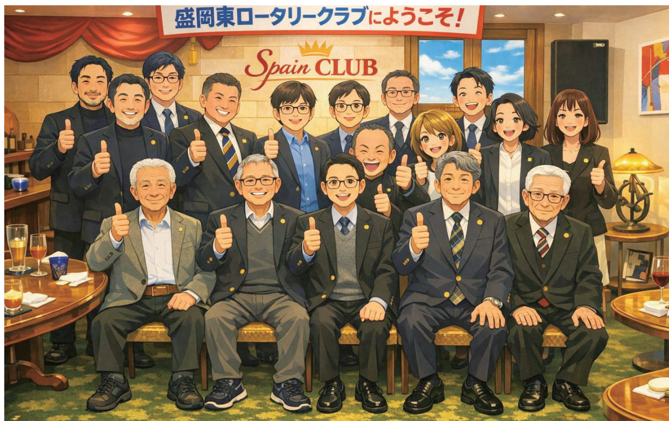
「笑顔でつながる盛岡東ロータリークラブの仲間たち」